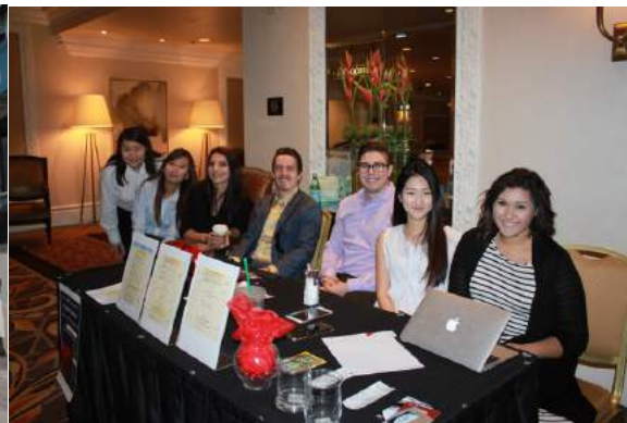
学会役員の方々（左）と受付の方々（右）