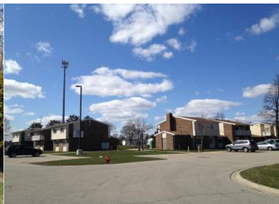
宿舎風景 (左側が私の宿舎)