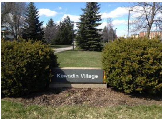
ケワディン ビレッジ (入り口)

アメリカミシガン州にあるセントラルミシガン大学(以下CMU)へ到着。デトロイト空港から車で約2時間30分所要。