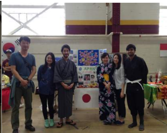
日本の留学生たち